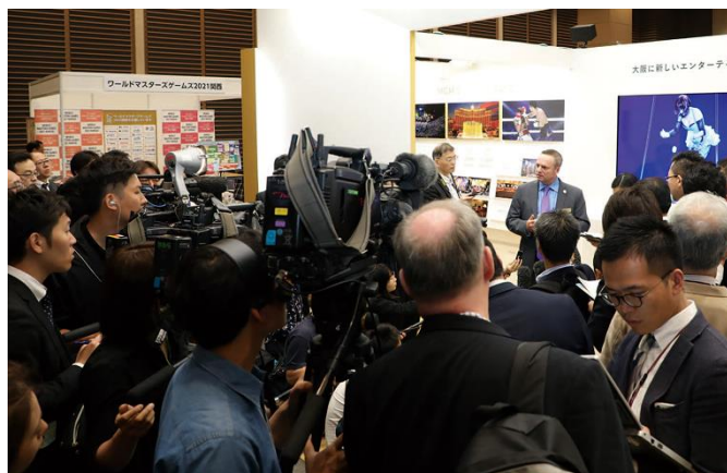
（2018 年 4 月 27 日「第 1 回関西 IR ショーケース」の様子）