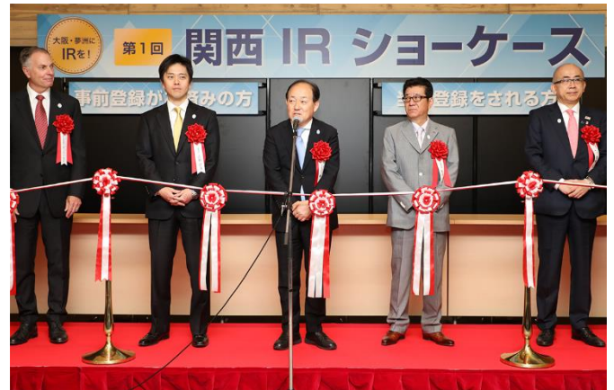
(2018年4月27日「第1回関西 IR ショーケース」の様子)