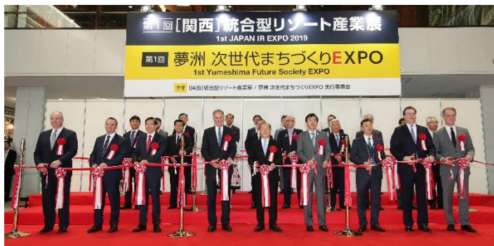
第1回 [関西] 統合型リゾート産業展 オープニングセレモニーのテープカット (2019年5月15日)

2018年7月の「特定複合観光施設区域整備法」いわゆるIR(統合型リゾート)整備法成立により、日本において滞在型観光を実現するための、カジノを含めた複合型観光施設の整備が進むこととなります。2019年8月には林文子横浜市長が山下埠頭へのIR誘致を表明するなど、最大3箇所のIR区域認定に向けて自治体の動きが活発化しています。「IRマーケット」の誕生が現実味を帯びてきている中で、経済界における見本市開催の要望の高まりを受け、日本型IRの実現に欠くことのできない商品・サービスが一堂に集結する展示会の開催を決定しました。大阪(2019年5月開催)、北海道(2019年12月開催予定)に続き、首都圏では初開催となる統合型リゾートに特化した産業見本市です。